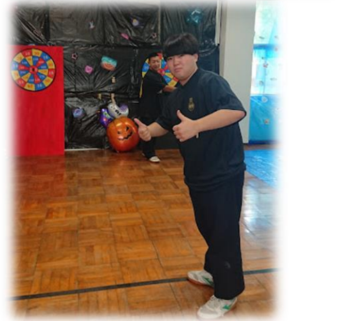
来年こそ制限なく実施できるといいですね！