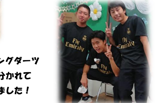
2-Bはフィッシングダーツ 釣りとダーツに分かれて それぞれ出店しました！